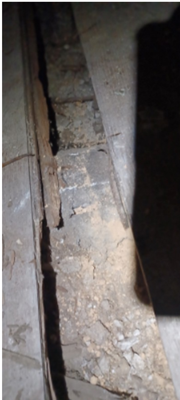
Maison / Rez-de-jardin / Salon 1 / Zone A / Plancher [grosse vrillette] [Prélèvement n°1]